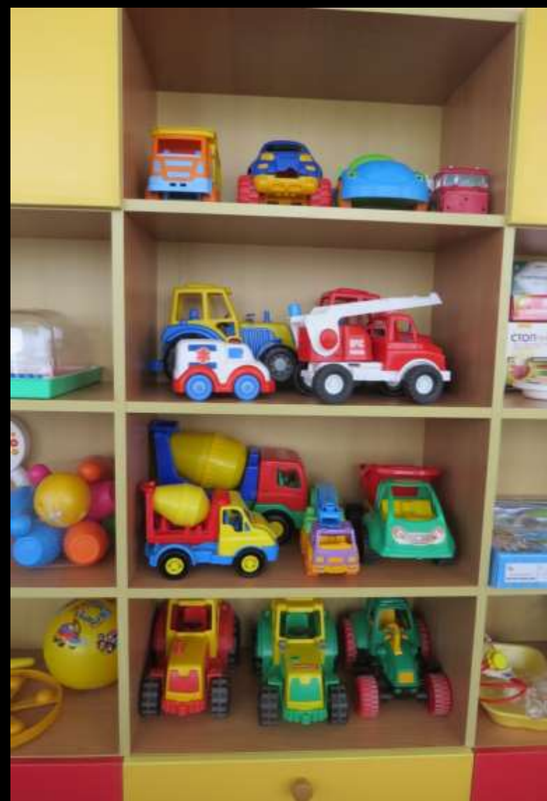
2.2.5. Активный сектор

Наличие атрибутов театрализованной деятельности (ширма-занавес, куклы-перчатки, театральные костюмы и др.), в том числе изготовленных вместе с воспитанниками.