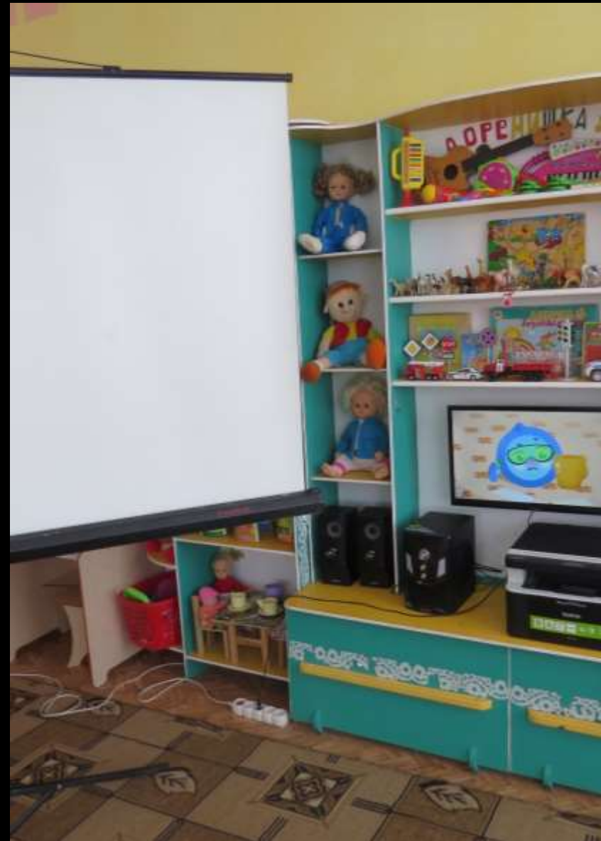
1.7. Рабочий сектор (ИКТ для педагога)